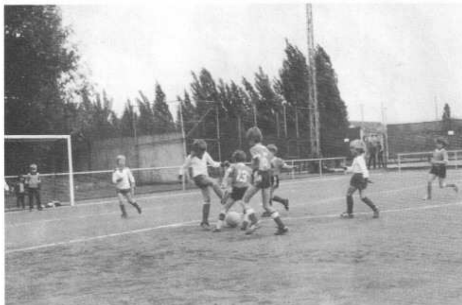
F-Jugend Spielszene aus VfR-Nordenstadt 2:0

20 Jugend-Mannschaften spielten am Wochenende des 30. Juni/1. Juli 1984 in vier Altersklassen um Pokale, Fairnesspreise und Urkunden.