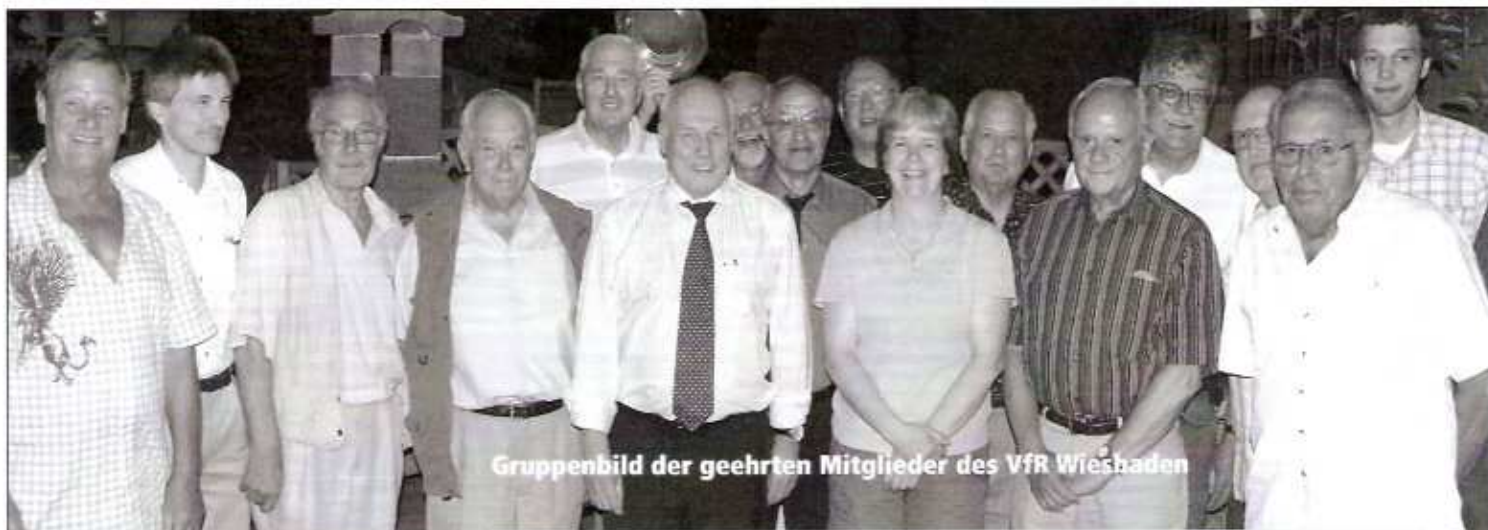
Gruppenbild der geehrten Mitglieder des VfR Wiesbaden