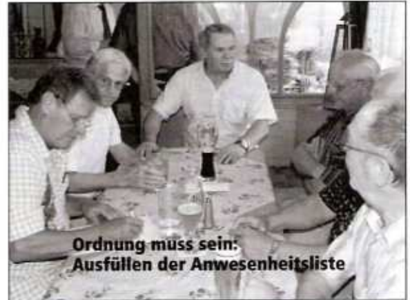
Ordnung muss sein: Ausfüllen der Anwesenheitsliste