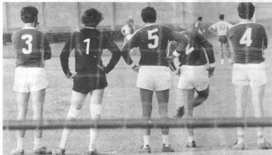
Großfeldhandball: Auch das gab's früher, Ruhe hinter dem eigenen Sturm

Was zu Beginn der Rückrunde nicht zu erwarten war, ist in der Tabellensituation der 3. Mannschaft leider eingetreten. Sie befindet sich in akuter Abstiegsgefahr. Platz 10 der Tabelle