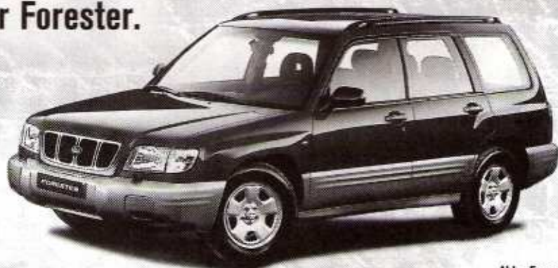
Abb.: Forester 2,0 GL