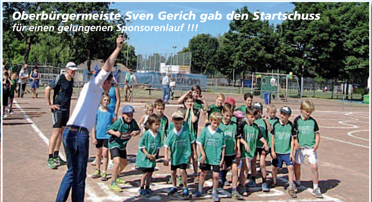
Oberbürgermeister Sven Gerich gab den Startschuss für einen gelungenen Sponsorenlauf !!!