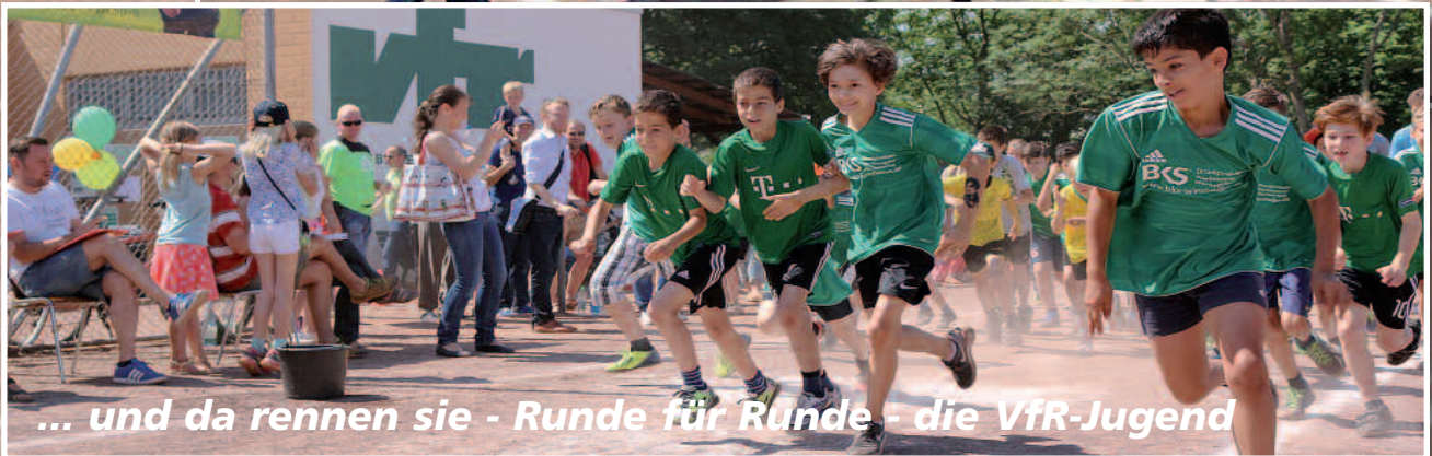
... und da rennen sie - Runde für Runde - die VFR-Jugend