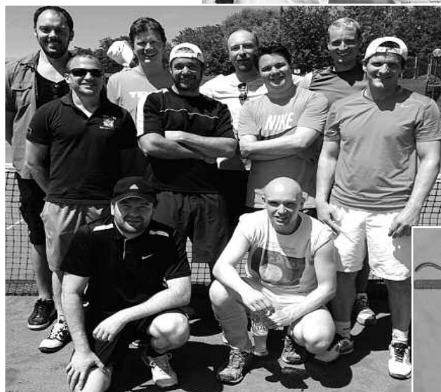
Bild unten: Vielen Dank unserem Shirt-Sponsor, die Farbkombination war sehr erfolgreich!!!