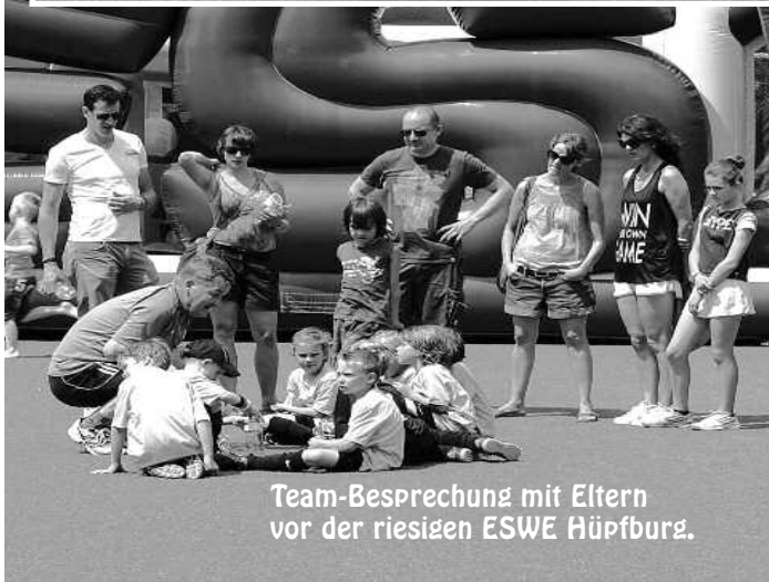
Team-Besprechung mit Eltern vor der riesigen ESWE Hüpfburg.