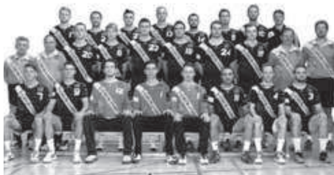
HSG Vfr/Eintracht peilt in dieser Spielzeit Platz unter den ersten Dreien an:

Heimsieg der HSG II mit 34:25 gegen die TG Kastel