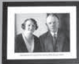
Ein schwelgerischer Mann

Zwei Personen sitzen an einem Tisch und trinken Bier. Der Mann trägt eine Mütze und einen Anzug. Die Frau trägt ein dunkles Kleid. Sie sind in einem Restaurant oder Café. Der Mann hat eine Zigarre im Mund. Die Frau hat eine Handtasche auf dem Tisch. Es gibt eine Bierflasche auf dem Tisch. Die Szene ist in Schwarz-Weiß dargestellt.