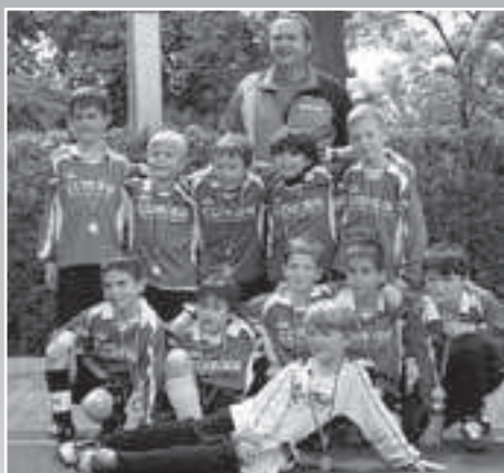
1. Platz beim Rheinhöhen-Cup

Ein Dank noch mal an dieser Stelle an alle Eltern, die mich im vergangenen Jahr unterstützt haben. Auf weiterhin gute Zusammenarbeit - Euer Thomas