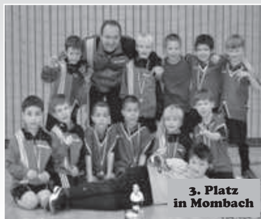
3. Platz in Mombach

In der Qualifikationsrunde zur F1 war es nun unser Ziel in die stärkste Gruppe zu kommen. Zwar wurden wir bei unserem Teiltturnier nur Dritter, da wir das 8-Meterschiessen im Halbfinale gegen den FC Bierstadt verloren hatten. Alle