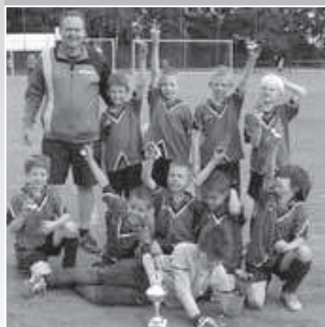
2. Platz beim Igstadt-Turnier

Weitere Erfolge waren der 1. Platz beim Rheinhöhen-Cup, ein 2. Platz beim Turnier in Igstadt und ein 3. Platz in Mombach. Hierbei ist zu erwähnen, dass wir nicht ein Spiel während der regulären Spielzeit verloren hatten, sondern leider immer nur im 8-Meterschiessen unterlagen.