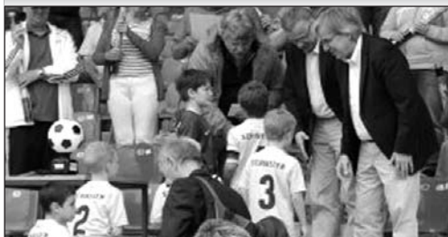
Die Mannschaft beim Empfang der Urkunde und einem Gutschein von Karstadt-Sport über 250,00 EURO

Einen besseren Saisonabschluss hätte man sich nicht vorstellen können. Das Ganze wurde am 27. Juni nach dem letzten Training mit einer Überraschungs-Party gekrönt.