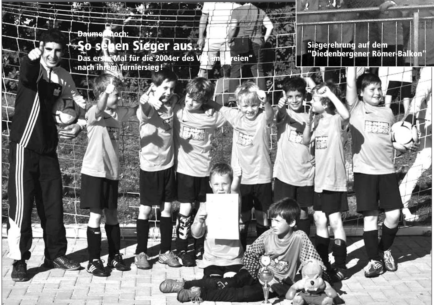
Daumen hoch: So sehen Sieger aus... Das erste Mal für die 2004er des VfR im "Freien" nach ihrem Turniersieg!