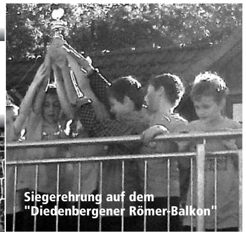
Siegerehrung auf dem "Diedenbergerer Römer-Balkon"