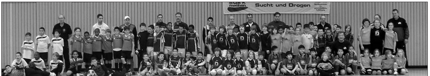
Gruppenbild der teilnehmenden Mannschaften