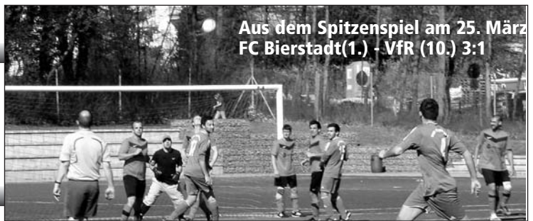
Aus dem Spitzenspiel am 25. März FC Bierstadt(1.) - VfR (10.) 3:1

Nachdem nun die ersten Spiele nach der Winterpause gespielt sind, müssen wir leider feststellen, dass es nicht reicht, einen schönen Fußball zu präsentieren, sondern das man dabei das Tore schießen nicht vergessen darf.