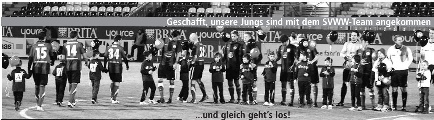
...und gleich geht's los!